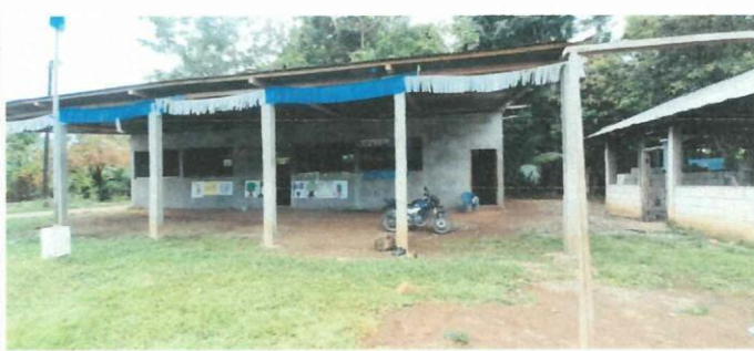
Foto 5: LADO DELANTERO DEL ESTABLECIMIENTO, EN DONDE SE REFLEJA LA SITUACION DEL TECHO ACTUAL