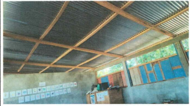
Foto 2: CAMBIO DE CUBIERTA DE LAMINA, A LAMINA TROQUELADA CALIBRE 26