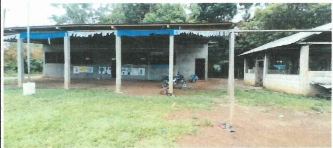
Foto 4: MAL ESTADO DE ESTRUCTURA DE TECHO Y LA CUBIERTA DE LAMINA