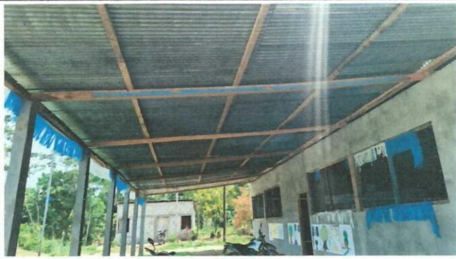
Foto1: CAMBIO DE ESTRUCTURA DE MADERA POR METAL